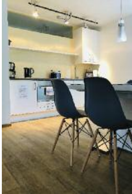
Moderne Küche mit Esszimmer

Helle, moderne Gästewohnung in der Ettlinger Straße 1