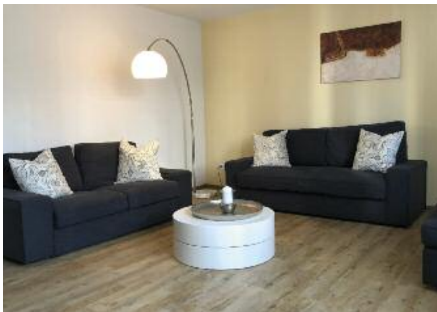
Das gemütliche Wohnzimmer